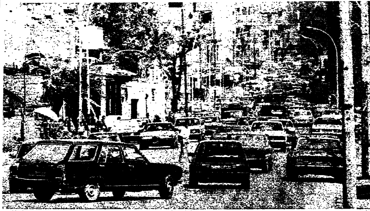
ازحام في فرن الشباك (جوزف فضول)